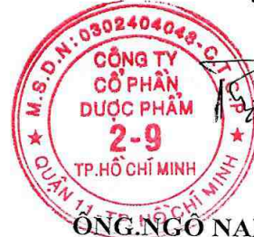
ÔNG.NGÔ NAM THẮNG